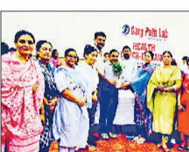
हरिभूमि न्यूज सिरसा