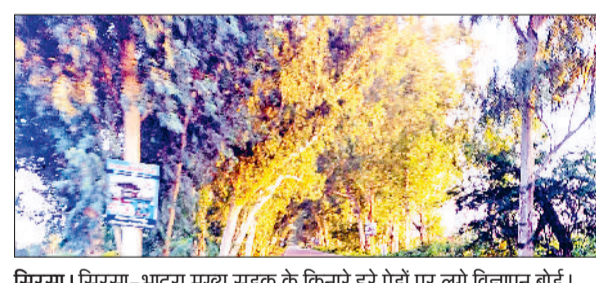
सिरसा। सिरसा-भादरा मुख्य सड़क के किनारे हरे पेड़ों पर लगे विज्ञापन बोर्ड।

इस तरह की ज्यादाती की गई हो। पहले भी कभी हरे पेड़ों को जानबूझकर सूखा दिया गया तो कभी आरी चलाकर काट दिया गया। अब हालात यह हैं कि पेड़ों पर कीलें टोक कर भारी-भरकम विज्ञापन