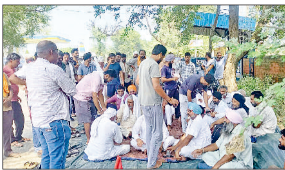
भूना। लहरियां पावर हाउस के बाहर धरना देते किसान।