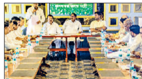
सिरसा। बैठक में मौजूद आज्य चौटाला, पूर्व डिप्टी सीएम दुष्यंत चौटाला व अन्य पदाधिकारी।

सिरसा। पूर्व डिप्टी सीएम एवं जेजेपी नेता दुष्यंत चौटाला ने कहा कि चौ. देवीलाल की 112वीं जयंती पर पूरे प्रदेश में जिला स्तर पर 112 कार्यक्रम आयोजित किए जाएंगे। 25 सितंबर को सभी जिलों में प्रार्थना सभाएं होंगी। दुष्यंत चौटाला मंगलवार को सिरसा में पार्टी कार्यकर्ताओं की बैठक लेने के बाद प्रचारकों से बातचीत कर रहे थे। उन्होंने कहा कि विशेष रूप से इस बार स्व. चौधरी देवीलाल के पुराने सभी साथियों जिन्होंने चौधरी देवीलाल के साथ काम किया और उनकी विचारधारा को जीवित रखा, ऐसे सभी साथियों को जिला स्तर