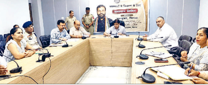
सिरसा। मलेरिया नियंत्रण कमेटी की बैठक लेते एडीसी।

जिला स्तरीय मलेरिया नियंत्रण कमेटी की बैठक मंगलवार को अतिरिक्त उपायुक्त वीरेंद्र सहरावत की अध्यक्षता में आयोजित की गई। बैठक में मच्छर जनित बीमारियों से बचाव एवं नियंत्रण के लिए विभिन्न विभागों की कार्ययोजना की समीक्षा की गई और आवश्यक निर्देश दिए गए। अतिरिक्त उपायुक्त ने कहा कि मच्छर जनित बीमारियों से बचाव