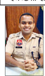
जैसे सार्वजनिक आयोजनों में कड़ी सुरक्षा व्यवस्था सुनिश्चित करने के लिए पर्याप्त पुलिस बल तैनात किया जाएगा, ताकि ये कार्यक्रम संचार एवं शांतिपूर्ण ढंग से संपन्न हो सकें। महिला सुरक्षा, सड़क सुरक्षा और विशेष जागरूकता कार्यक्रम चलाए जाएंगे। इन अभियानों के माध्यम से

जिले में चलेंगे जनहित के बहुपक्षीय अभियान, स्वच्छता से लेकर सड़क सुरक्षा तक जोरदार मुहिम